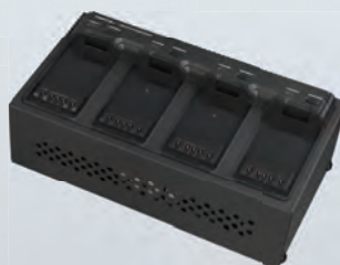
防爆電池パック対応(4ヶ用)