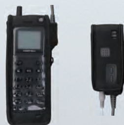
コードレス端末(フックタイプ)／アセンブリ用