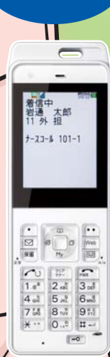
防水タイプ*2 BISINESTA 301JR