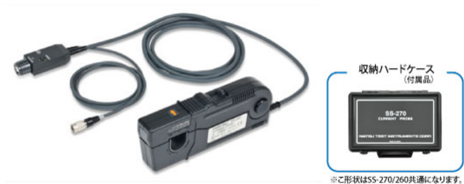
※ご形状はSS-270/260共通になります。