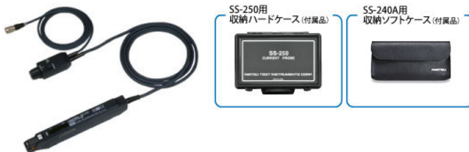
SS-250 / SS-240A 本体 (電源が別途必要になります)