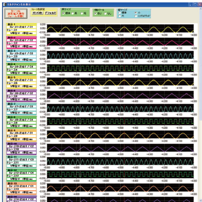
各チャンネル表示例