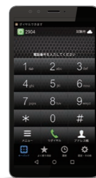
スマホどこでも内線の画面イメージ

※スマホどこでも内線をご利用いただくには、別途機器及び月額利用料金が必要となります。