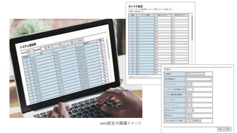
web設定の画面イメージ

PCブラウザ上でFrespec-sにアクセスすることで、回線設定、端末設定のほか迷惑電話設定や夜間切替設定、ボイスメール設定などの詳細な設定を必要に応じてカスタマイズ可能です。