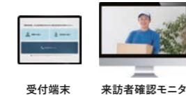
受付端末 来訪者確認モニタ