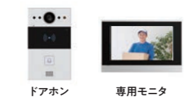
ドアホン 専用モニタ