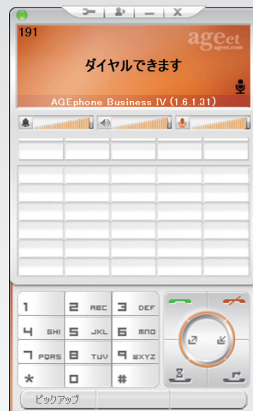
— 画面イメージ —