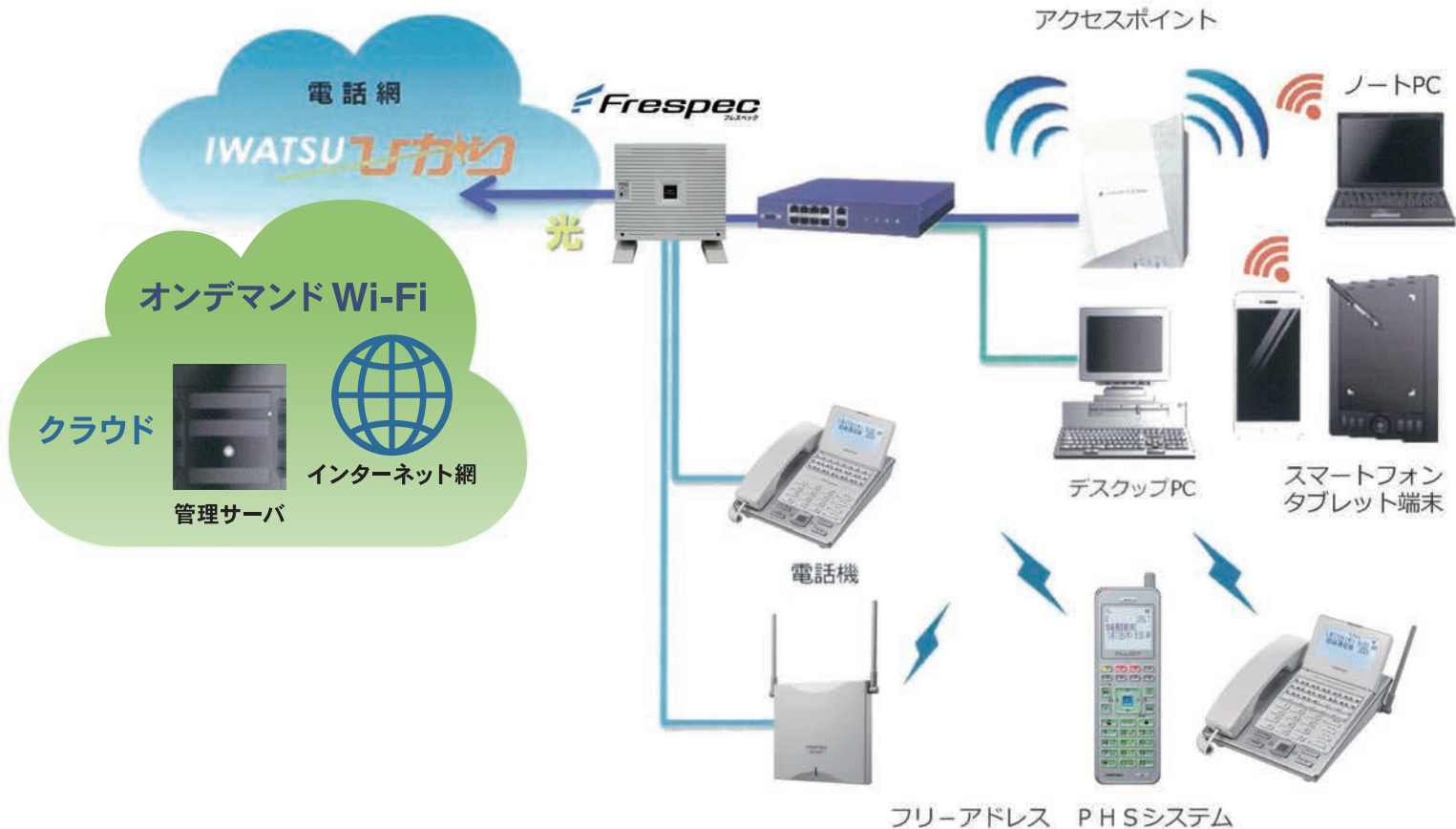
【システム構成イメージ図】