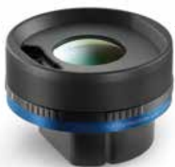
標準レンズ 単品価格：330,000円(税込：363,000円)